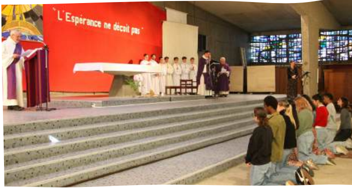
Catéchumènes se présentant, lors de la messe des familles à St-Liboire, le dimanche 2 mars 2025.