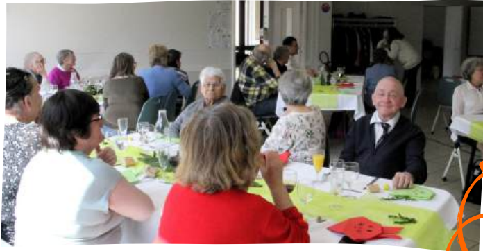
Repas solidaire Accueil et Solidarité Diaconale (A.S.D.) au centre paroissial du Pré, le dimanche 13 avril 2025.