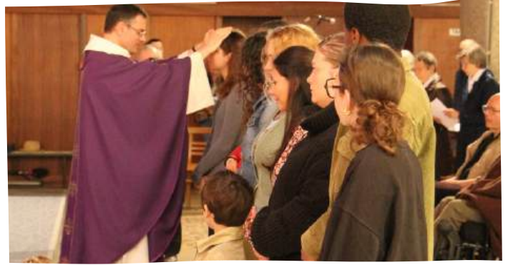
3ème scrutin des catéchumènes, lors de la messe des familles à St-Liboire, le dimanche 6 avril 2025.