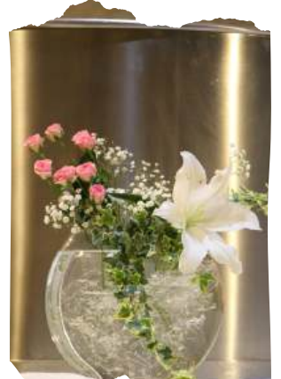
Les magnifiques compositions florales des fleuristes en liturgie.