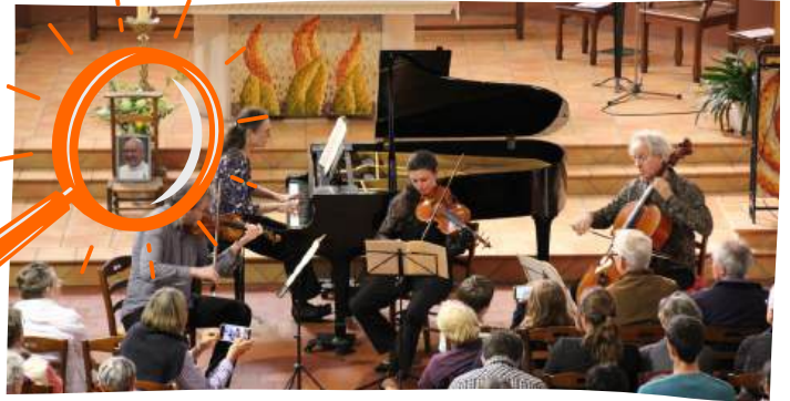
Sonates de printemps « AU FIL DU RHIN », œuvres de Clara WIECK-SCHUMANN, L. VAN BEETHOVEN et Robert SCHUMANN, le dimanche 27 avril 2025.