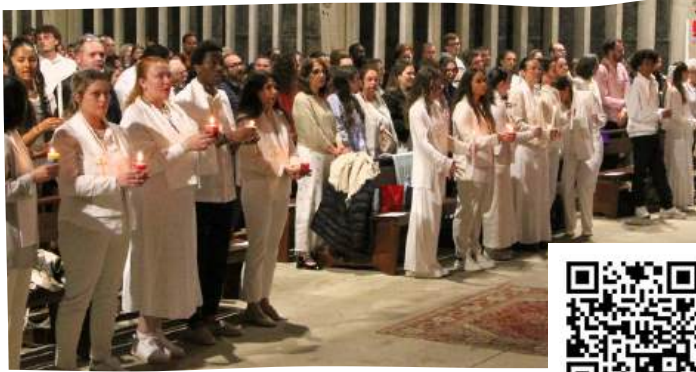
Samedi 19 avril 2025 à St-Liboire.