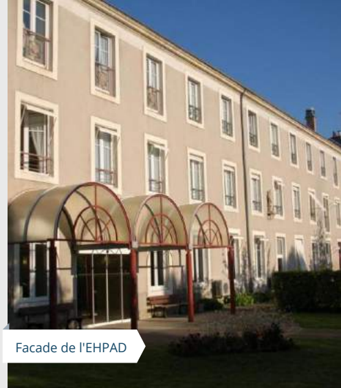
Facade de l'EHPAD

« Chaque fois que vous l'avez fait à l'un de ces plus petits qui sont mes frères, c'est à moi que vous l'avez fait. » Mt 25,40