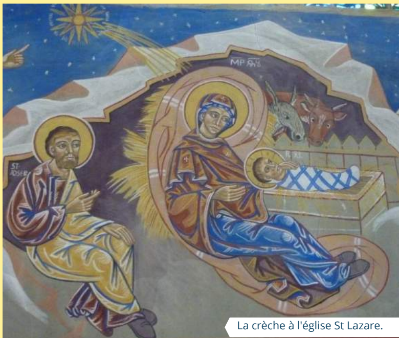
La crèche à l'église St Lazare.

L'année suivante, les habitants de Greccio avaient raconté avec tant d'admiration les merveilles de cette belle nuit de Noël que, un peu partout, on se mit à reconstituer, dans des grottes ou des étables, la scène touchante de la naissance de Jésus. (source : franciscain.org )